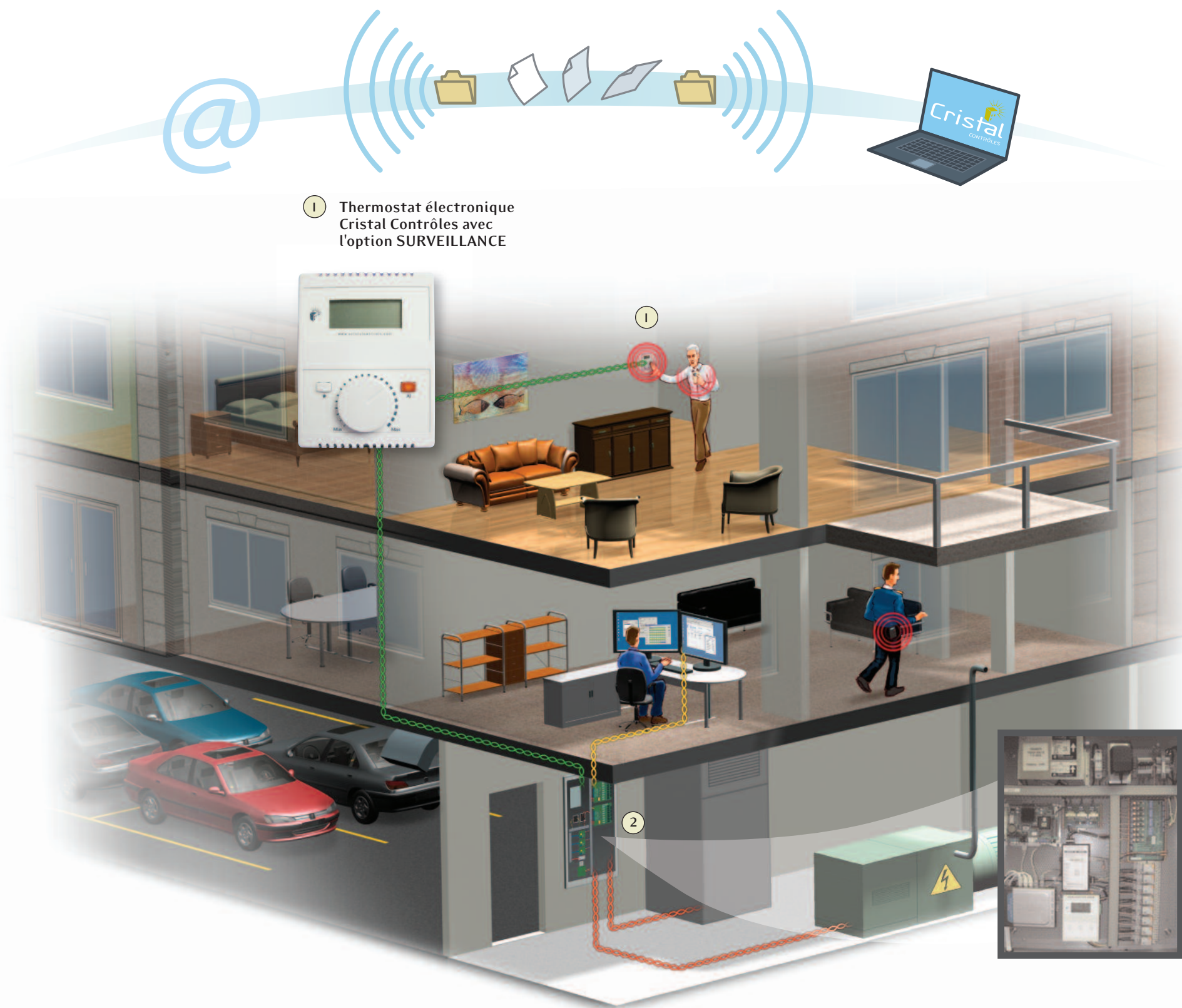
1 Thermostat électronique Cristal Contrôles avec l'option SURVEILLANCE

Grâce aux systèmes de gestion d'énergie de Cristal Contrôles, vous économiserez :